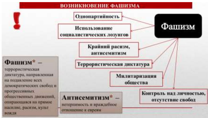
Рис. 4. Структурно-логическая модель с термином «Фашизм»

Работа с графической моделью способствуют развитию логического мышления, умения анализировать информацию, выделять главное.