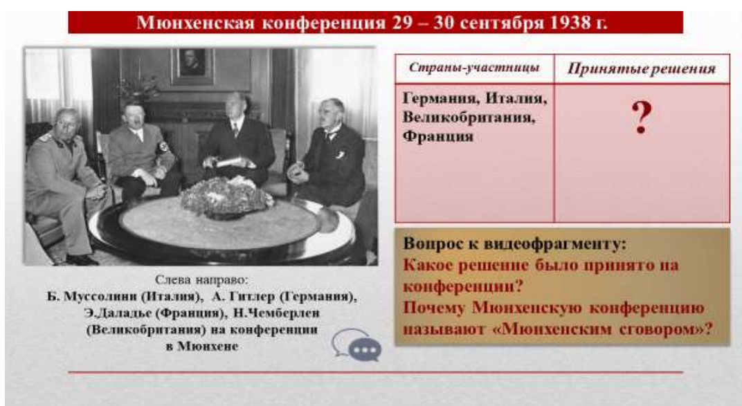
Рис. 9. Работа с видео фрагментом по теме «Международные отношения в 1930-х гг.»

Цель задания: формирование у учащихся умения объяснять причины решений, принятых на Мюнхенской конференции.