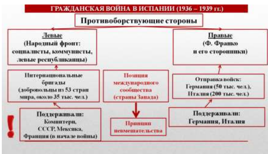
Рис. 3. Структурно-логическая схема «Гражданская война в Испании (1939-1939 гг.)»

Цель задания: формирование у учащихся умения характеризовать состав участников и их цели в Гражданской войне в Испании.