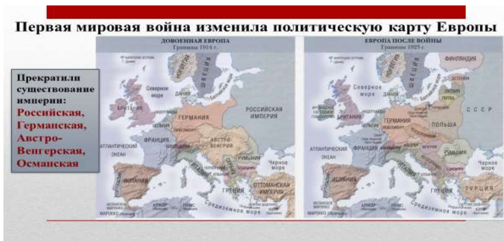
Рис. 8. Прием «перекрестных карт» по теме «Страны Центральной и Юго-Восточной Европы»

характеристики исторического факта, явления, события. При изучении темы «Страны Центральной и Юго-Восточной Европы» (всемирная история, 9 класс) для понимания изменений, которые произошли на политической карте Европы после Первой мировой войны, предложен приём «перекрестных карт», который позволяет учащимся локализовать исторические события, проводить сравнение исторических явлений (Рис. 8).