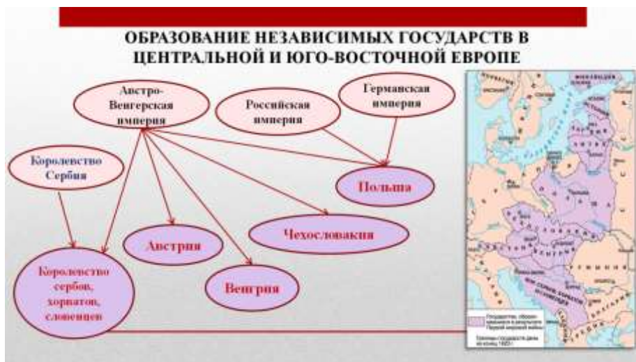
Рис. 5. Кластер «Образование независимых государств в Центральной и Юго-Восточной Европе»

Ещё одной графической формой представления учебного материала, которая позволяет синтезировать текстовую информацию в лаконичной форме, раскрывать сущность изучаемых понятий и осуществлять рефлексию на основе полученных знаний, является кластер. Кластер (структурно-логическая схема) решает поставленные задачи и при актуализации знаний, и при работе над новым материалом.