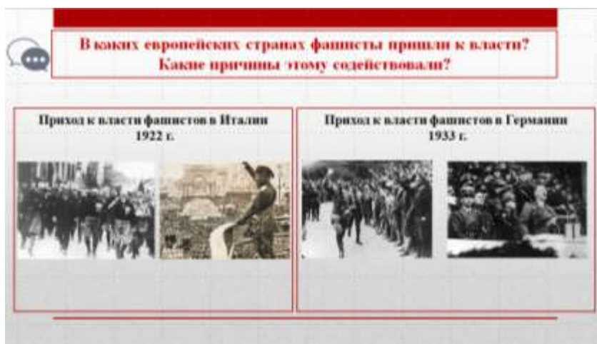
Рис. 2. Вопрос для актуализации знаний учащихся при изучении темы «Борьба против фашизма в европейских странах накануне Второй мировой войны»

В начале изучения темы «Борьба против фашизма в европейских странах накануне Второй мировой войны» (всемирная история, 9 класс) учащимся с опорой на представленные фотографии предлагается вспомнить, в каких европейских странах фашисты пришли к власти (Рис. 2).