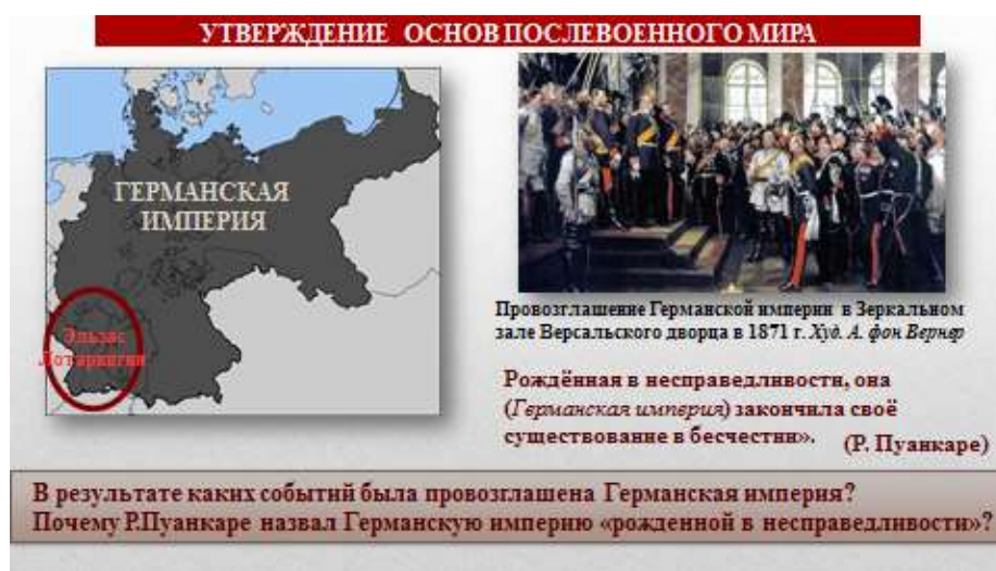
Рис. 1. Вопрос для работы с иллюстративным материалом

Например, на этапе актуализации знаний на уроке всемирной истории в 9 классе по теме «Утверждение основ послевоенного мира» учитель предлагает учащимся на основе представленного визуального ряда вспомнить изученный материал и ответить на поставленные вопросы (Рис. 1). Сочетание разнообразного визуального материала (репродукция картины, картосхема, высказывание политического деятеля), нестандартные задания вызывает интерес учащихся к поиску ответов на поставленные вопросы.