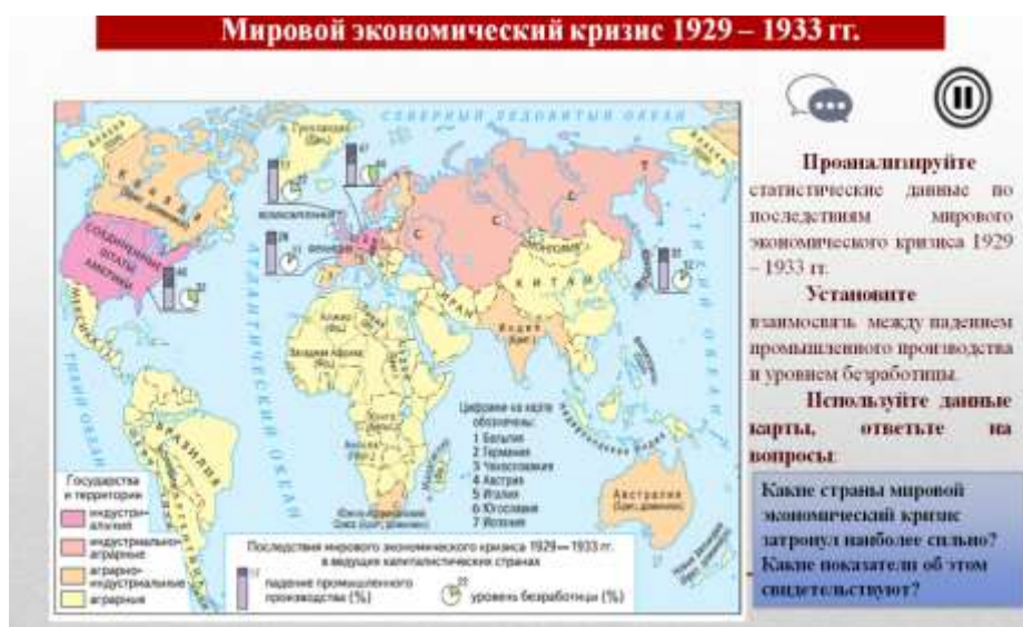
Рис. 7. Работа со статистическими данными по теме «Мировой экономический кризис 1929-1933 гг.»

Цель задания: формирование у учащихся умения на основе анализа статистических данных делать выводы.