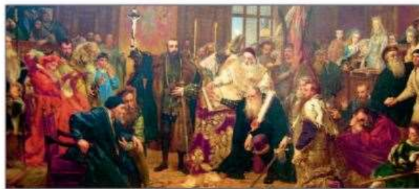
▲ Люблинская уния. Художник Я. Матейко. XIX в.

Использование иллюстративного ряда в учебном пособии по истории Беларуси для 8 класса 2010 г при изучении темы «Образование Речи Посполитой» (с. 12)