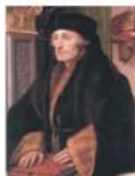
Эрasmus Роттердамский. Художник: Х. Хольбейн Младший. 1523 г.