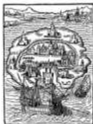
Остров Утопия. Иллюстрация к книге Т. Мора «Утопия». 1516 г.