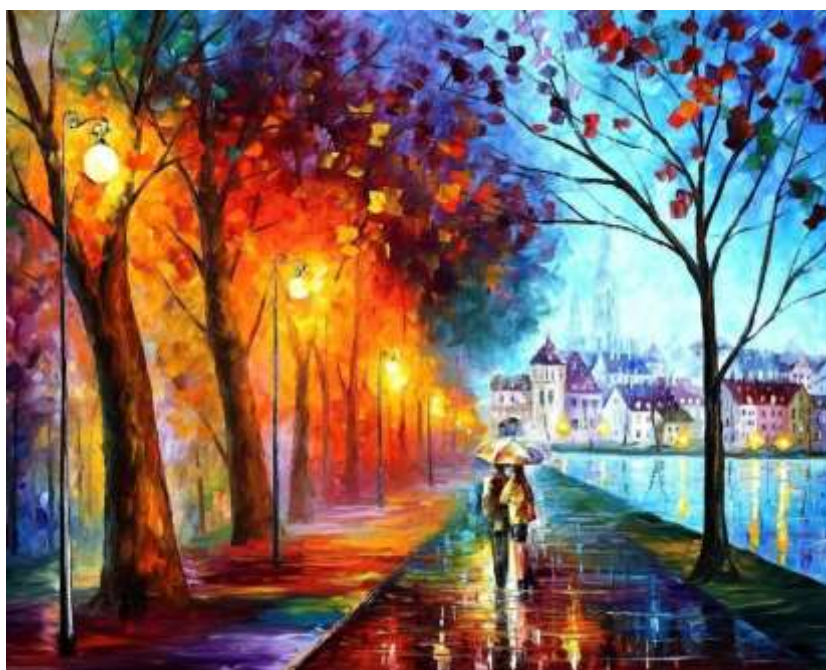
Дождевая аллея у реки. Художник Леонид Афремов.

Приём основан не только на целостном отображении образов, но и на творческой реконструкции отображённой действительности в звуках, словах, разговорах людей. Для анализа картины через акустическое измерение целесообразно использовать определённый алгоритм.