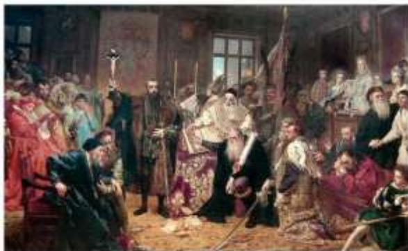
Люблинская уния. Художник Я. Матейко. 1869 г.

Использование иллюстративного ряда в учебном пособии по истории Беларуси для 8 класса 2010 г при изучении темы «Образование Речи Посполитой» (с. 12)