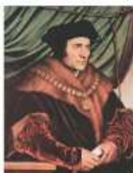
Т. Мор. Художник: Х. Хольбейн Младший. 1524 г.