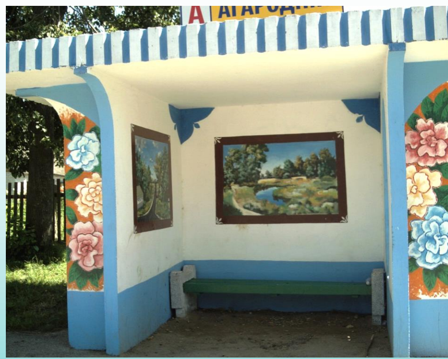
Остановка – картинная галерея в д. Огородники (Каменецкий район)