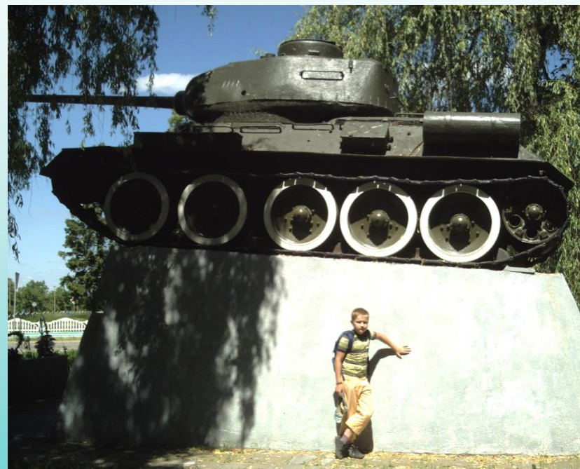
Памятник воинам-освободителям на братской могиле в д. Пелище (Каменецкий район)