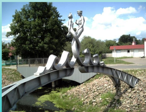
Пружаны 14 ч. 12 мин.