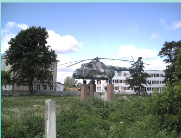
Кобрын 10 ч. 36 мин.