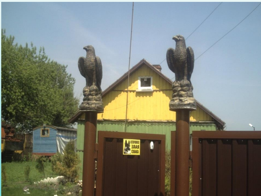
Деревня Чижевичи (Брестский район)