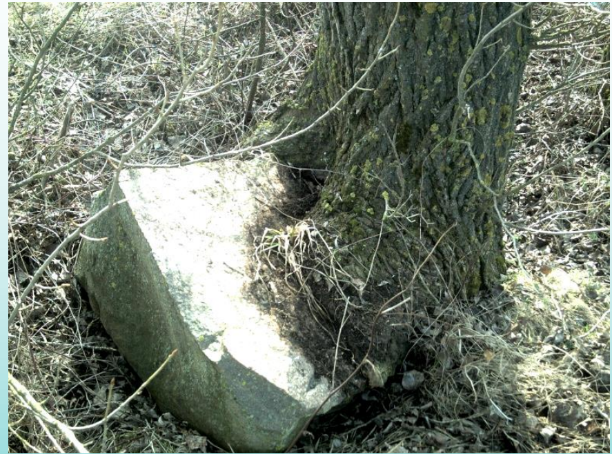
Тесный союз дерева и валуна. д. Черни (Брестский район)