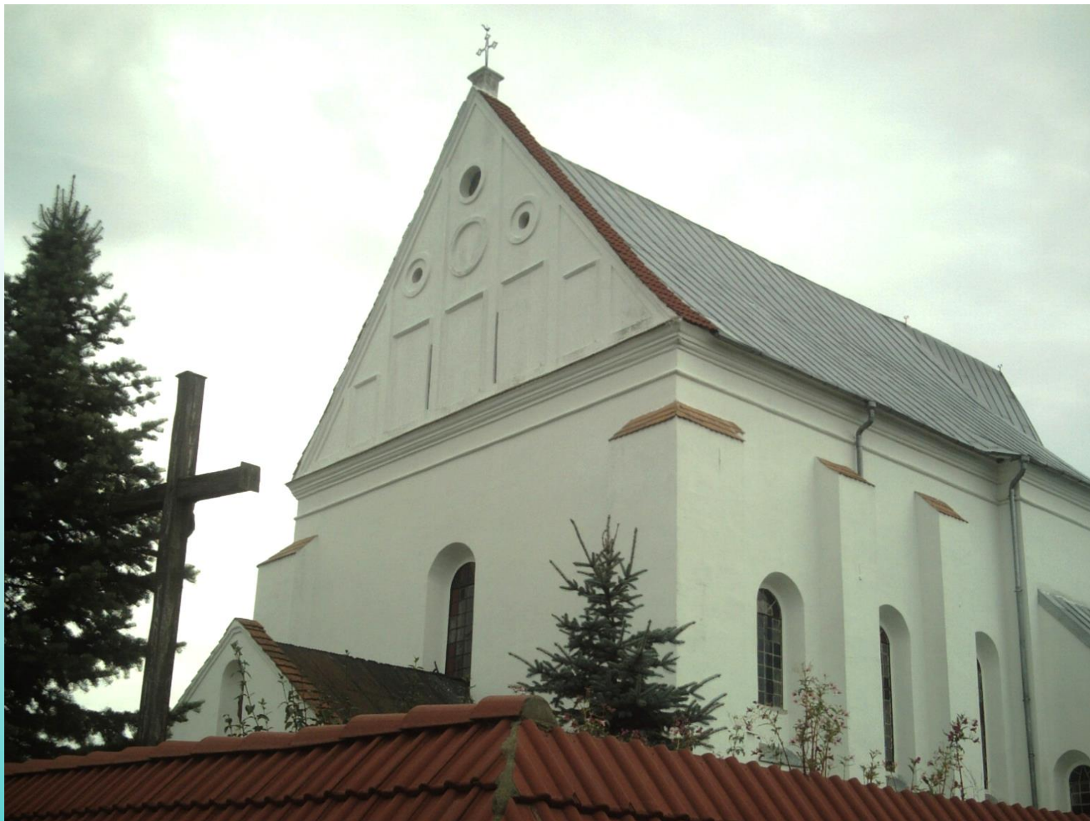
Троицкий костёл XVI в. в д. Чернавчицы (Брестский район) имеет нулевую (высшую) категорию памятников культурного наследия Республики Беларусь