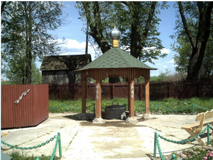
Родник д.Тумин (Каменецкий район)