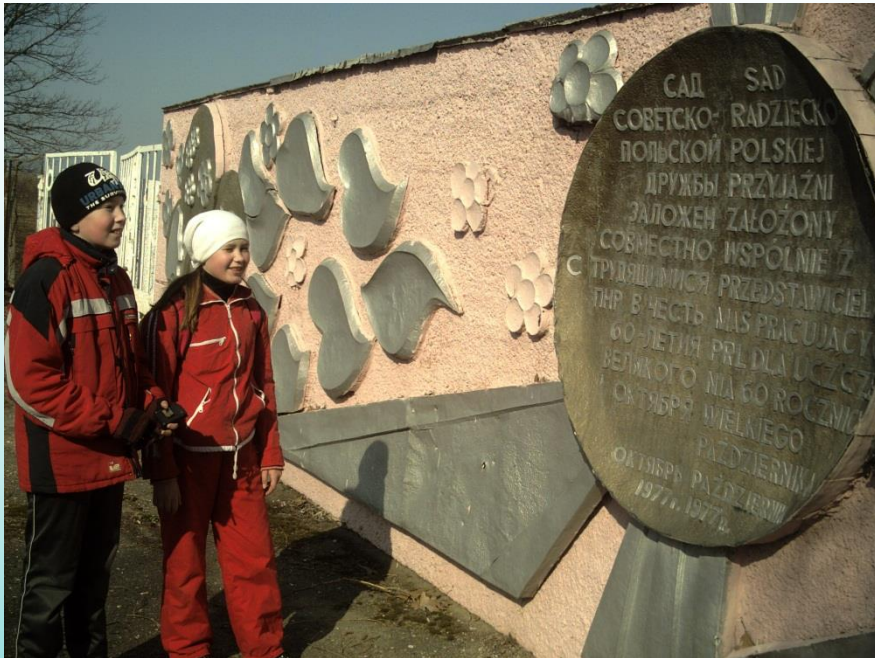
Сад «Дружба» д. Смуга (Брестский район)