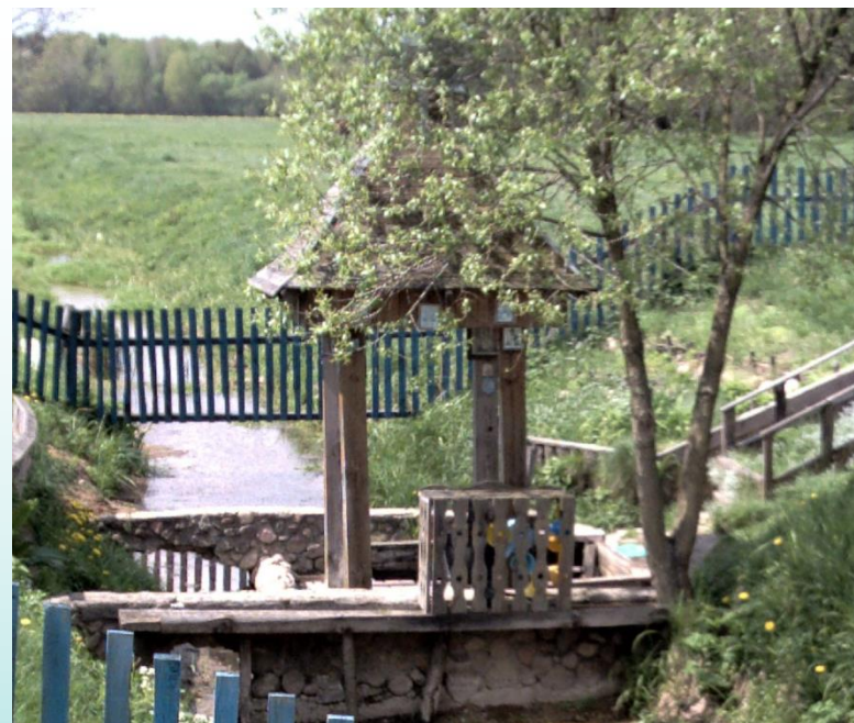
Святой источник д.Вежное (Пружанский район)