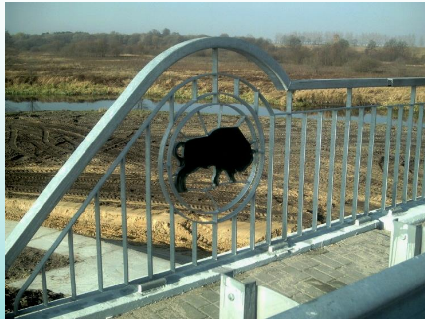
Фрагмент моста через реку Левая Лесная (Каменецкий район)