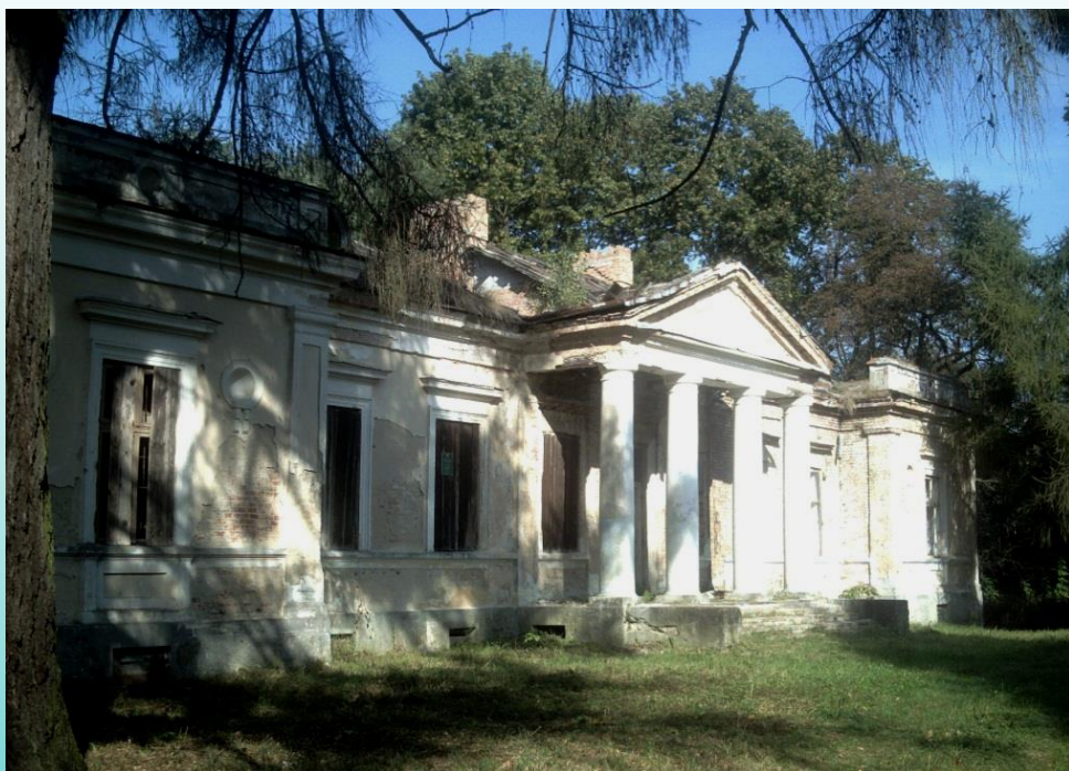
Усадебный дом в д. Гремяче (Каменецкий район)