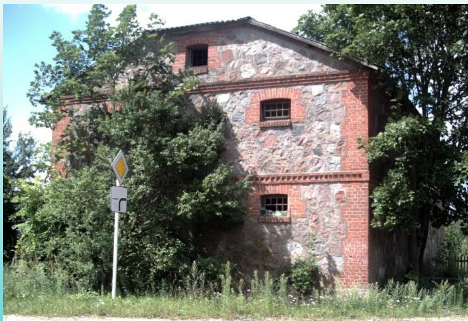
Амбар д. Ратайчицы (Каменецкий район)