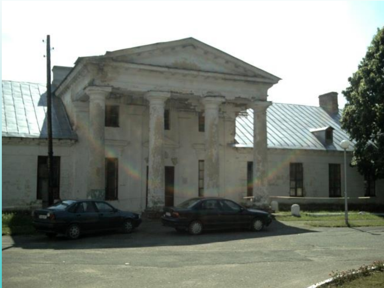
Фрагмент дворца Город Высокое