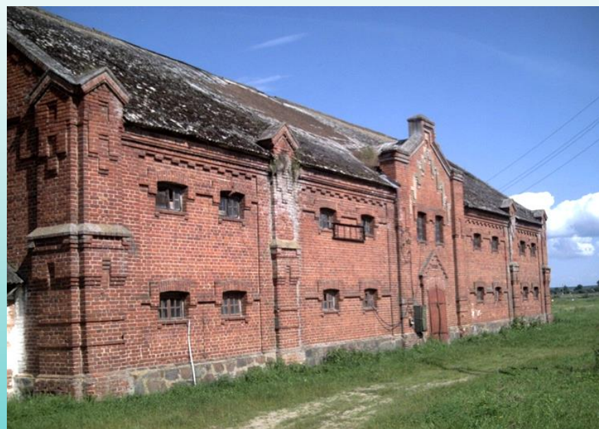
Хозяйственная постройка 1911 г. д. Копылы (Каменецкий район)