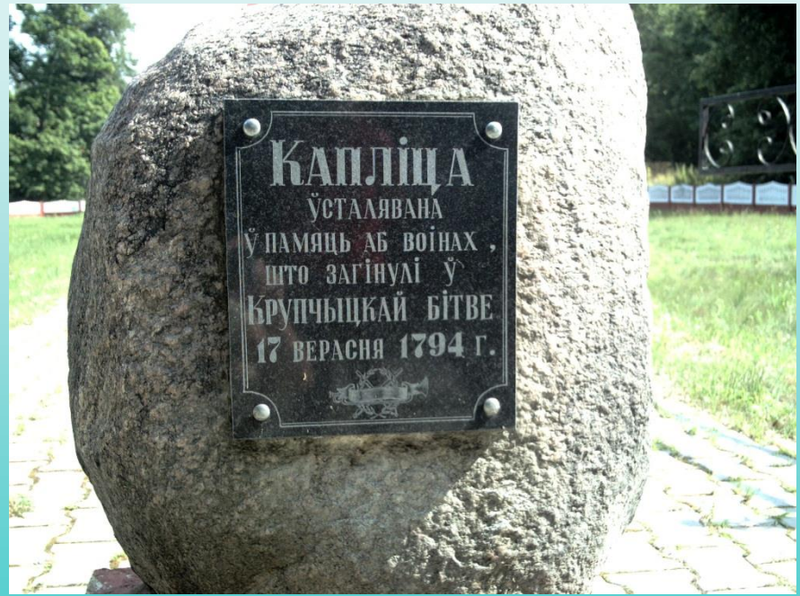
Деревня Чижевщина (Жабинковский район) – место Крупчицкой битвы 1794 г.