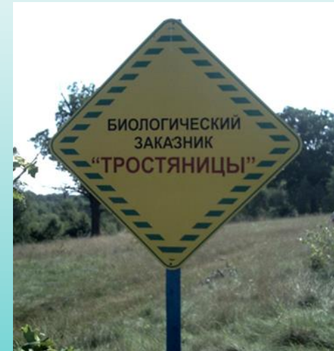
Биологический заказник «Тростяницы» в Каменецком районе