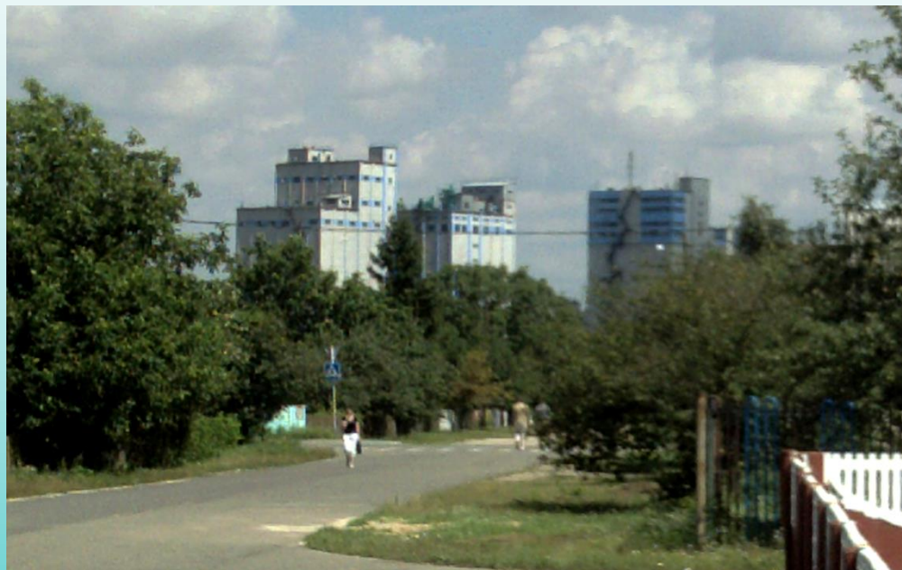
Город Жабинка Комбикормовый завод