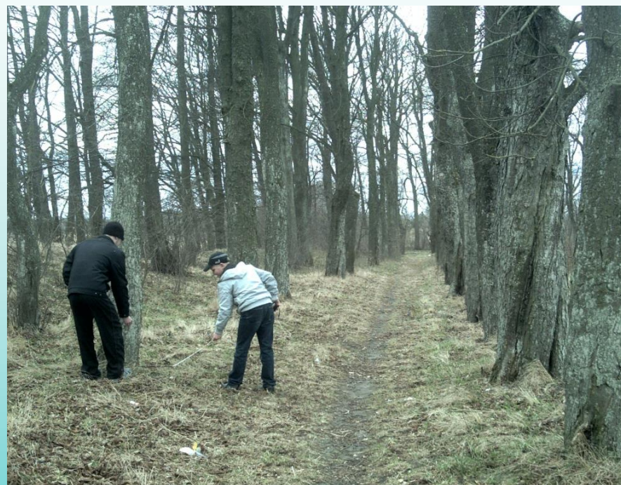
Аллея в парке д. Малые Зводы (Брестский район)