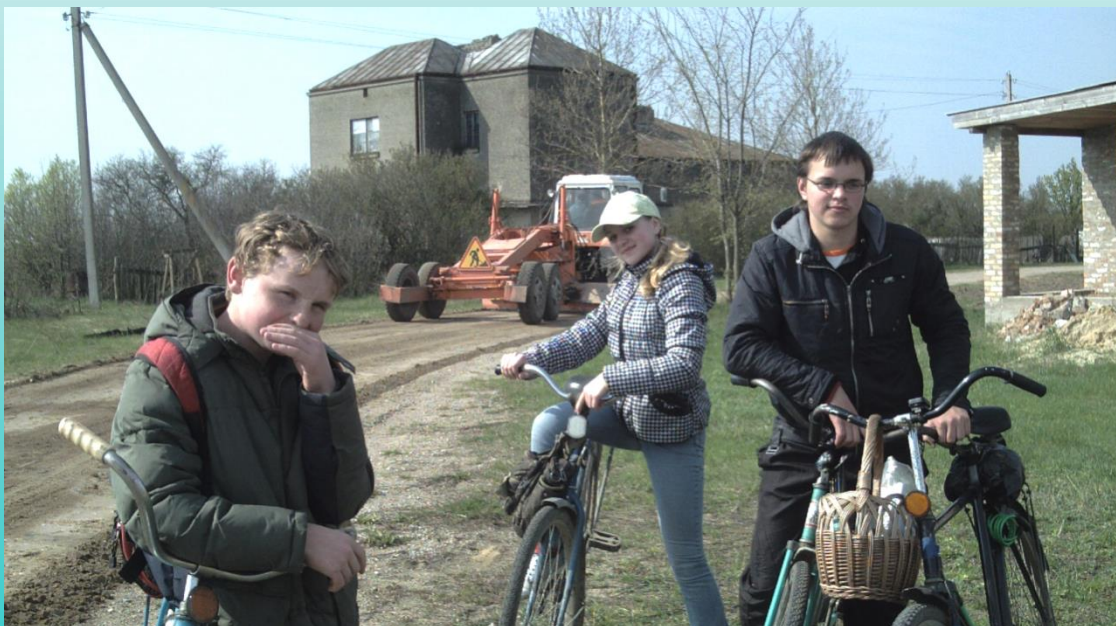
Фото на фоне бывшей школы в деревне Зеленец (Брестский район)