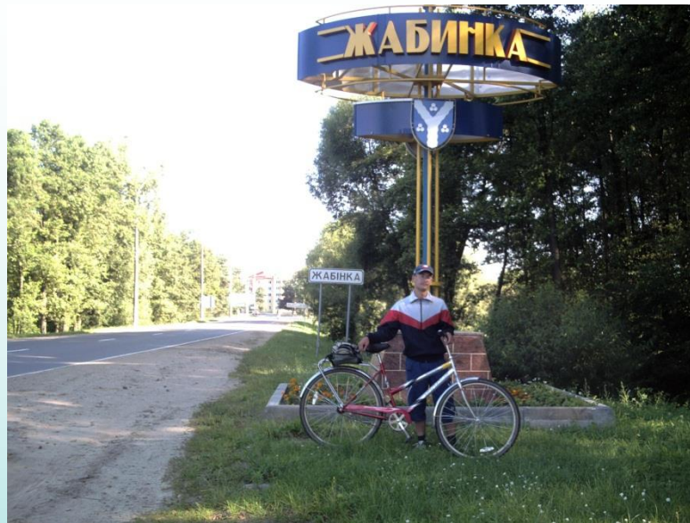
Жабінка 8 ч. 52 мин.