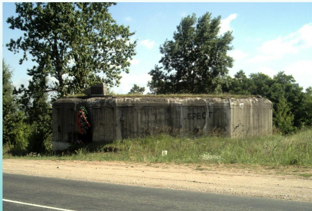
ДОТы, свидетели боёв в июне 1941 года Деревня Огородники Каменецкого района и город Брест