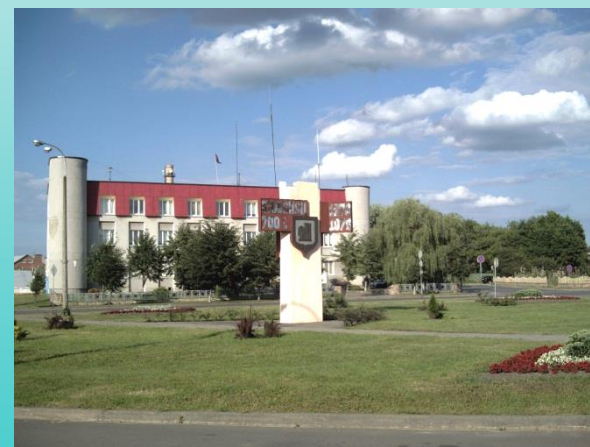
Каменец 18 ч. 44 мин.