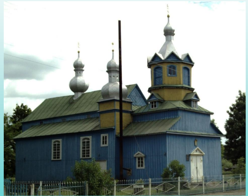
Свято-Михайловская церковь в д. Степанки (Жабинковский район)