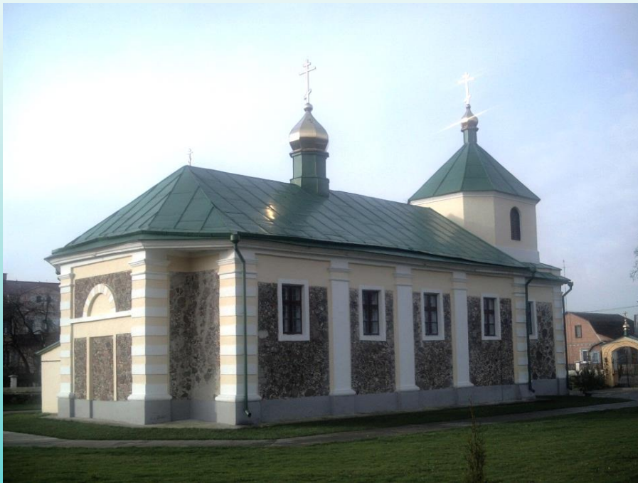
Свято-Михайловская церковь в д. Остромечево (Брестский район)