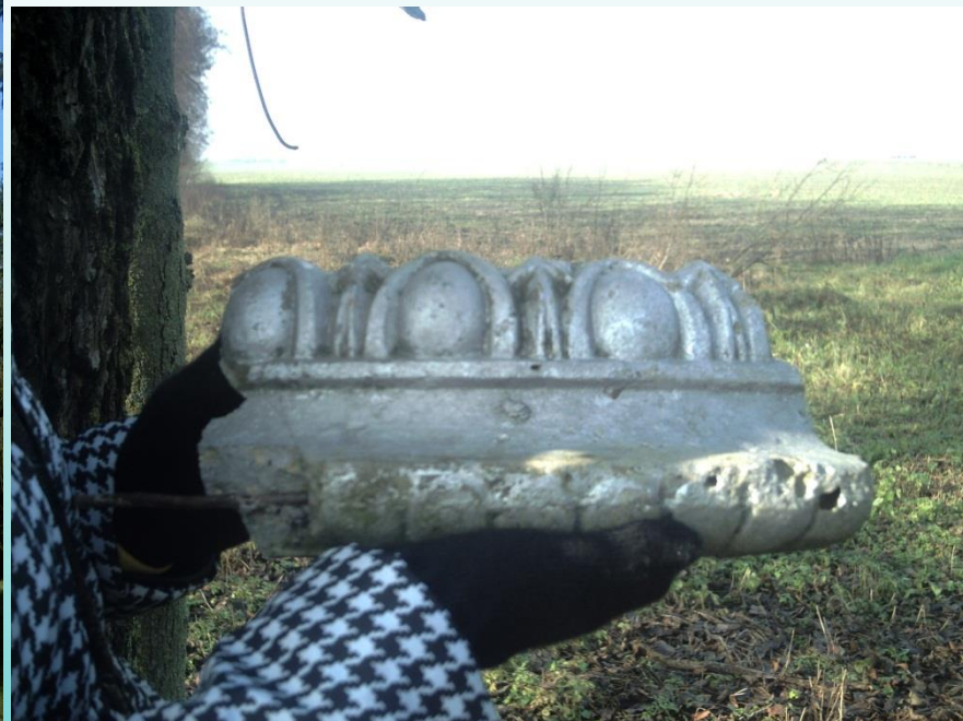
Фрагмент керамики Парк д. Сычи (Брестский район)