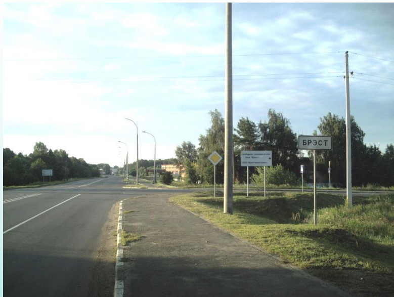
Брест 6 ч. 51 мин.