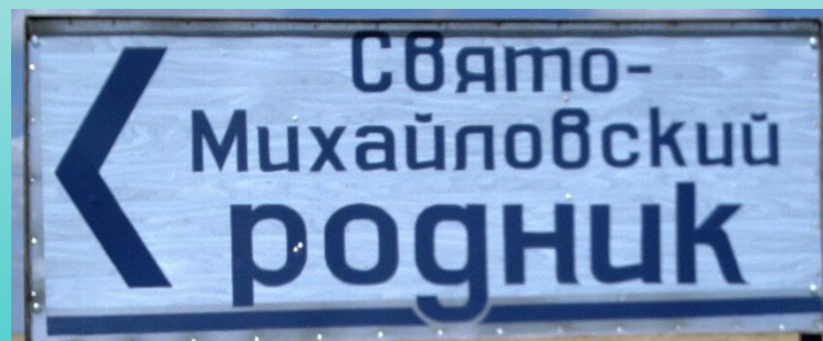
Свято-Михайловский родник д.Огородники (Каменецкий район)