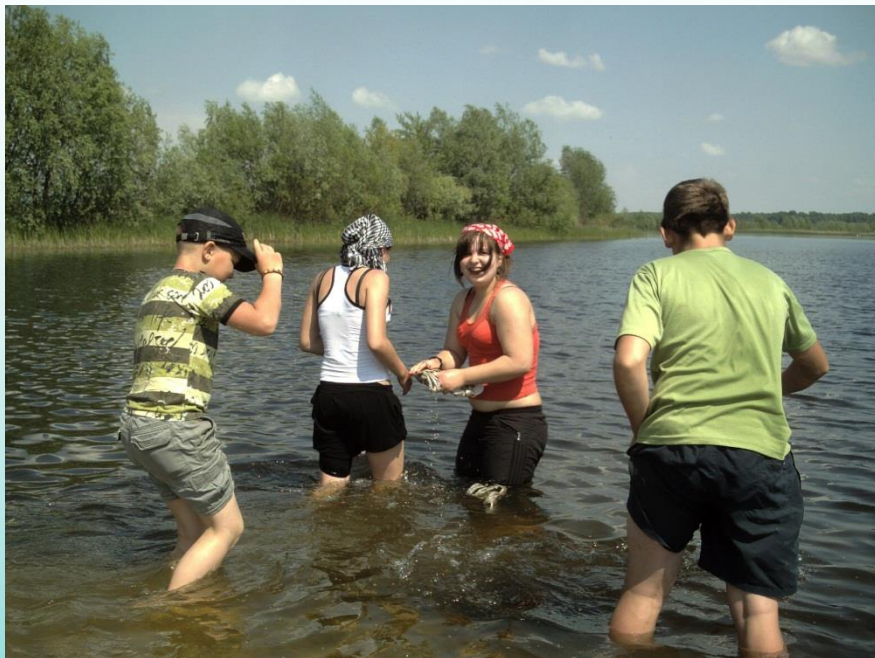
Пруд в деревне Омелинно (Брестский район)