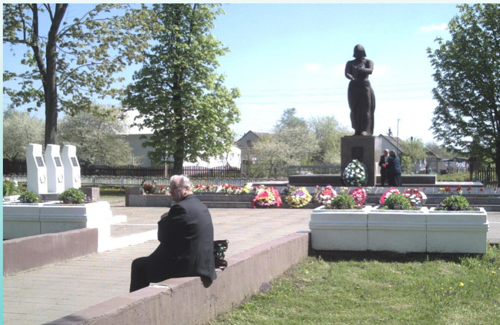
Памятник на братской могиле в д. Чернавчицы (Брестский район)