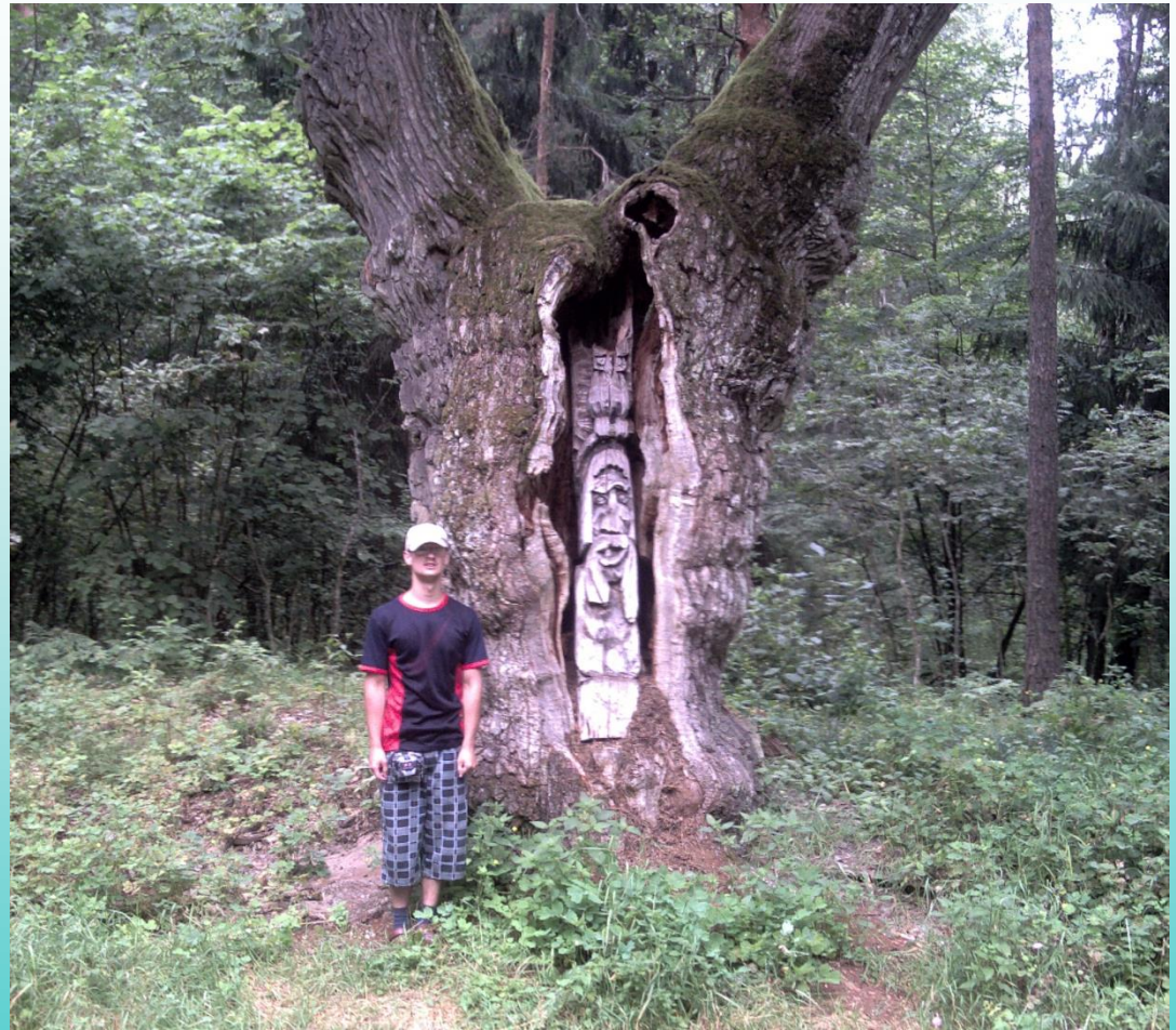
Дуб-патриарх и дуб-отшельник в Национальном парке «Беловежская пуца»