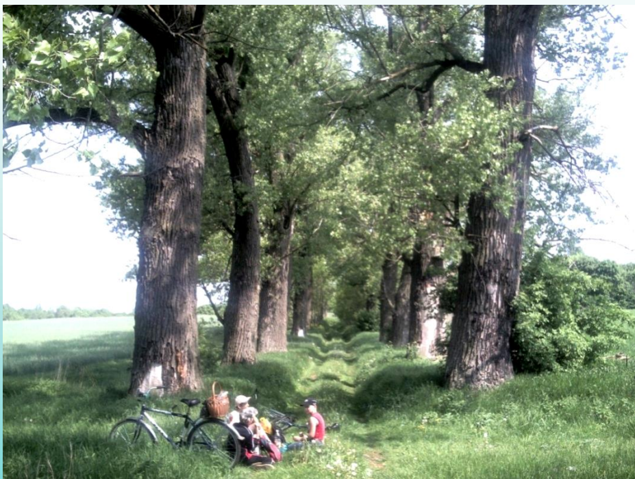
Въездная аллея к усадебному дому в д. Большая Раковица (Брестский район)