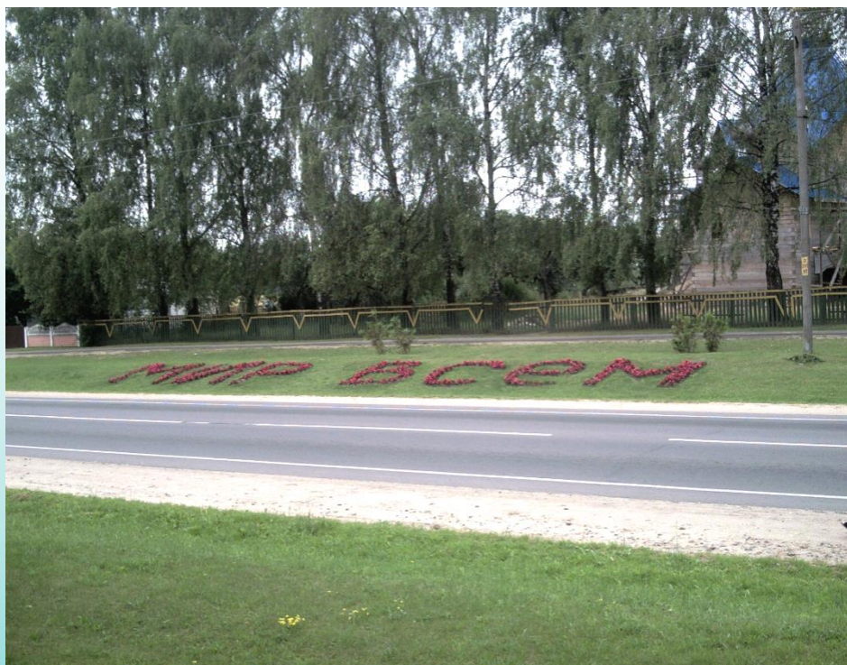
Пожелание всем проезжающим д. Видомля (Каменецкий район)