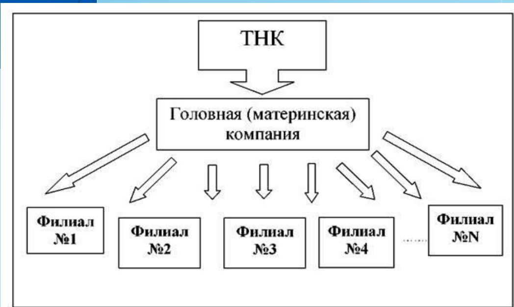
Рис. 9.10. Сеть филиалов транснациональной компании.