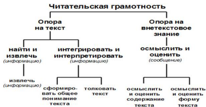
Рис.1. Связи читательских умений

Все три уровня читательских умений тесно взаимосвязаны, они востребованы при выполнении разных учебных заданий. На рис. 1 представлены связи всех названных выше читательских умений.